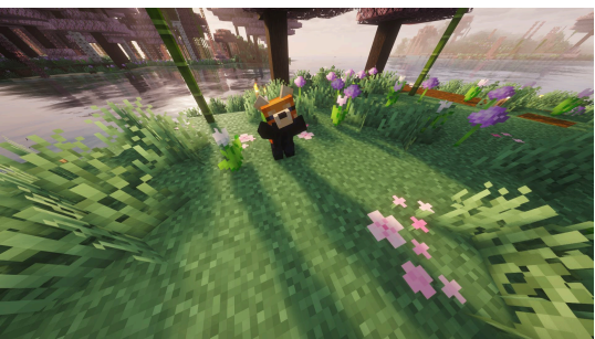
xd que subnormal