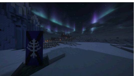
Vinland, nueva facción